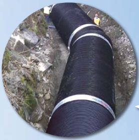
Yakima Teton Irrigation District, WA