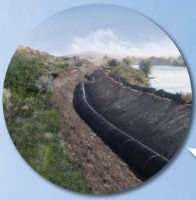
Barker Ranch, WA