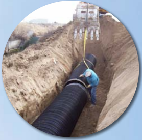
East Columbia Basin, WA