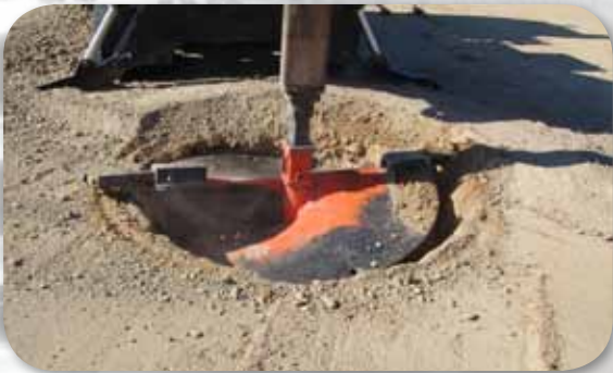
Colocación de ademe ocurre antes de cualquier perforación.

Secciones ligeras para transportar económicamente al pozo.