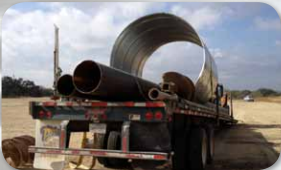
Ligero para manejo y transporte fácil.