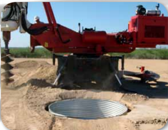
Ademes otorgan un receso superficial seguro.

Un tubo de ademe de gran diámetro que se establece en el suelo para proporcionar la base inicial estructuralmente estable para una perforación o pozo de petróleo proporcionando un receso para superficie del suelo para el acceso y la seguridad. Esto se establece normalmente antes de realizar cualquier operación de perforación.